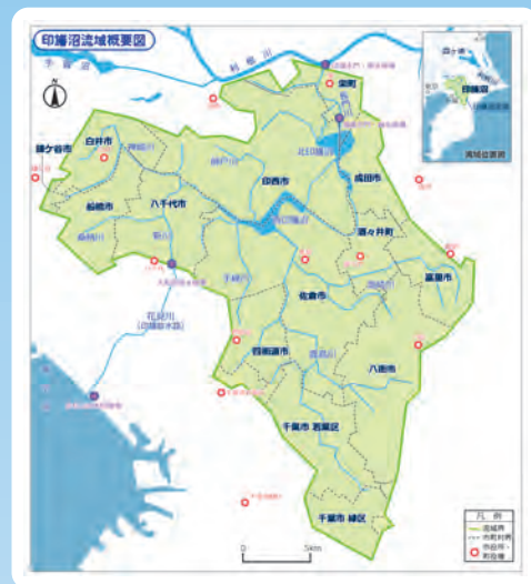
●印旛沼連携プログラムの対象エリア 印旛沼や流入河川に流れが繋がっている沼、川、 水路のうち、千葉県・市町・土地改良区・水資源 機構が管理者であるものがプログラムの対象と なります。

あなたの近所の小さな水路も印旛沼につながっています。 印旛沼の再生は、身近な川や水路をきれいによくする 取り組みからはじまります。